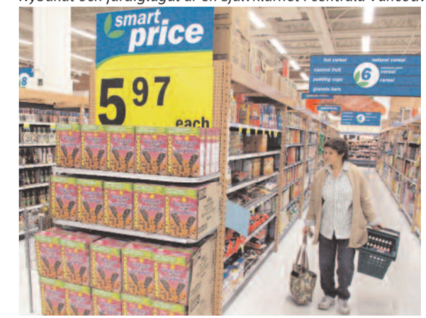
PriceSmart är en av få renodlade lågprisbutiker i Vancouver. Whole Foods Market satsar helhjärtat på säsongvaror.