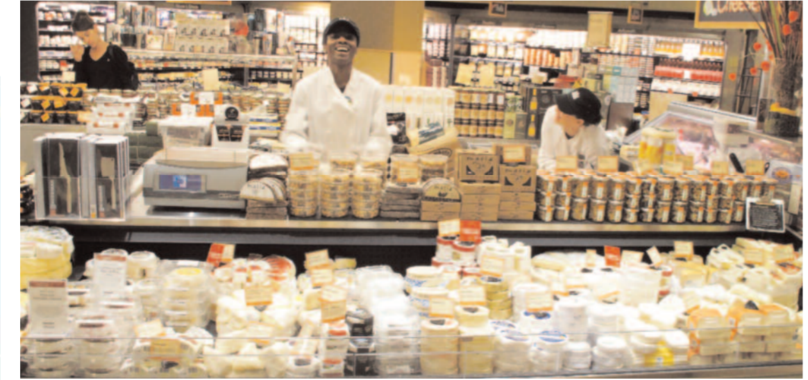
Whole Foods Market har två stora och två mindre butiker i Vancouver. Lågkonjunkturen har inte dämpat efterfrågan på ekologiska produkter.