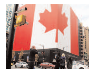
Centrum i Vancouver byggs om inför vinter OS.

Bland konkurrenterna finns Choices Markets med åtta butiker och amerikanska Whole Foods Market. Whole Foods Market har